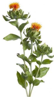
Färberdistel / 2. Zug Rosa